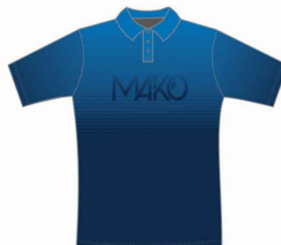
POLO NATATION PRO 02008 NAT (homme et enfant) 16008 NAT (femme)