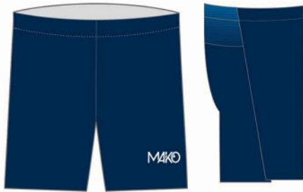
SHORT LONG NATATION PRO MK 08731 PS NAT (homme et enfant)