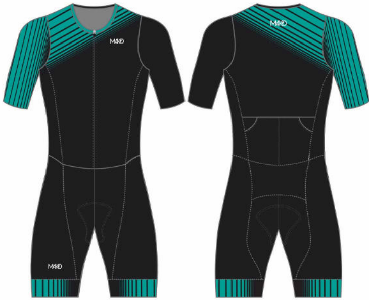
LINES : SEA