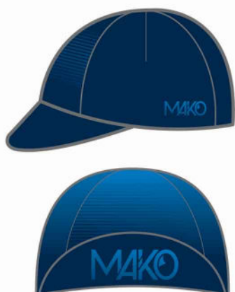
CASQUETTE VELO 1152