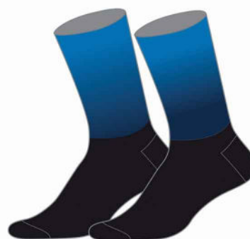
CHAUSSETTES RUNNING SUBLIMEES 01601 SUB