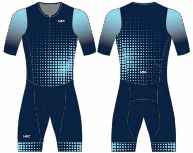
SPOTS : NAVY