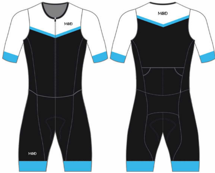
SMALL CHEVRON : TURQUOISE