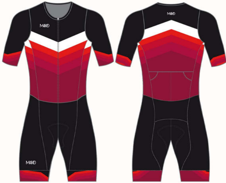
CHEVRON : RED