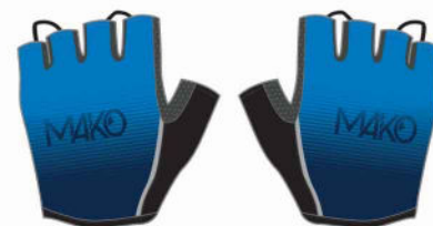
GANTS VELO 01012