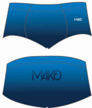
SHORTY homme et garçon MK21001