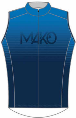
COUPE VENT SANS MANCHE PRO 03610 (unisexe)