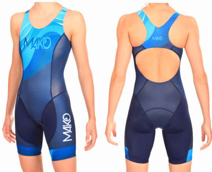
TRI TEAM FEMME MK 0610SP