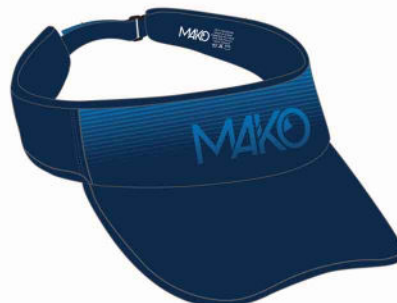
VISIERE RUNNING MK 07035