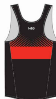
DEBARDEUR RUN TEAM 06015 (homme et enfant) 16115 (femme)