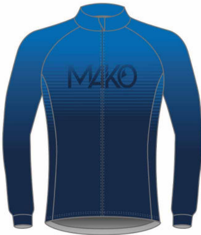
VESTE MI-SAISON PRO 02164 PRO+ (homme) 02104 PRO+ (femme)