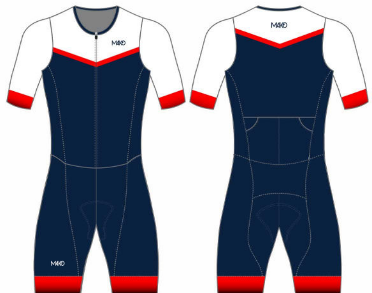
SMALL CHEVRON : RED