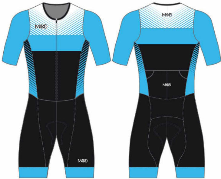
LINE FADE : TURQUOISE