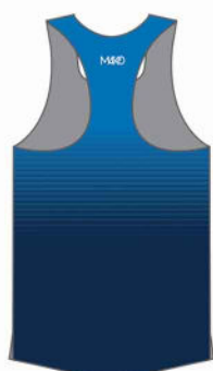
DEBARDEUR RUN PRO 06016P (homme) 16116P (femme)