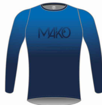
T-SHIRT RUN PRO MK 03001 (homme) MK 03501 (femme col rond) MK 03640 (femme col V)