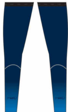
JAMBIERES VELO 07185 (unisexe)