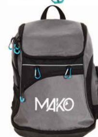
SAC À DOS 5180001 (noir ou gris)