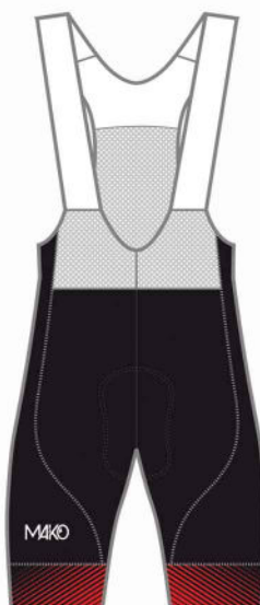
CUISSARD COURT TEAM 04031 PB (homme et enfant) 16031 PB (femme)