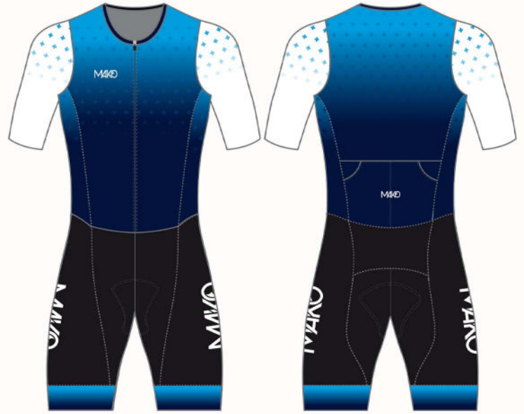
CROSS FADE : BLUE