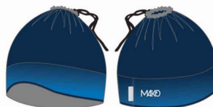
TOUR DE COU / BONNET MK 01013