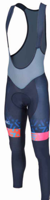
CUISSARD LONGUE HIVER PRO 07093 (unisex)