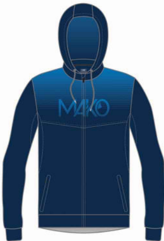
SWEAT NATATION PRO MK 18620 NAT (homme et enfant) MK 20820 NAT (femme)