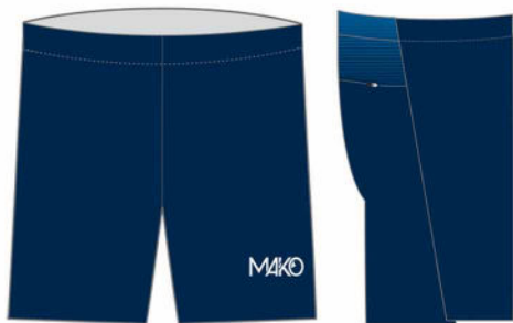
SHORT RUN COURT PRO 08650 ST (homme)