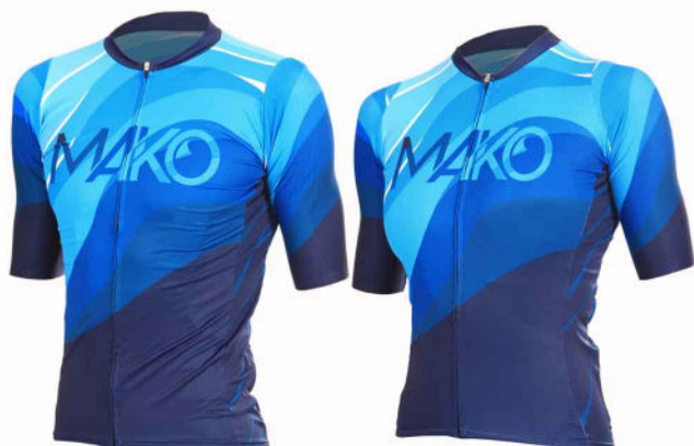
MAILLOT VELO PRO 02096PRO (homme) 02098PRO (femme)