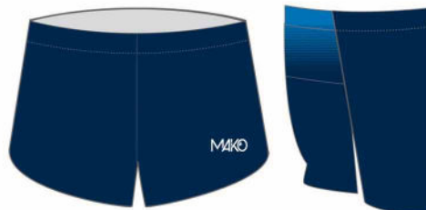
SHORT RUN LONG PRO 08501 SE (homme et enfant)