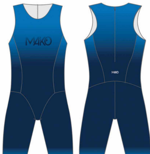
TRI PRO MEN 0100SE (sans peau) 0101SEP (avec peau)