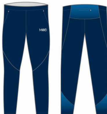
PANTALON RUN PRO MK 50101 (unisex et enfant)