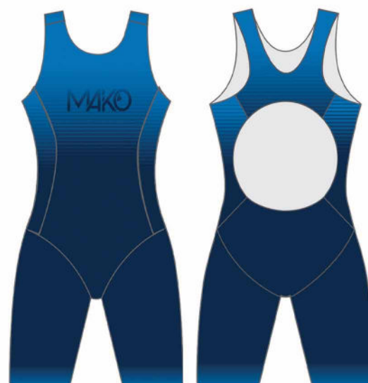
TRI PRO FEMME 0500SE (sans peau) 0501SEP (avec peau)