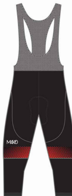
CUISSARD 3/4 TEAM 08741 (unisex)