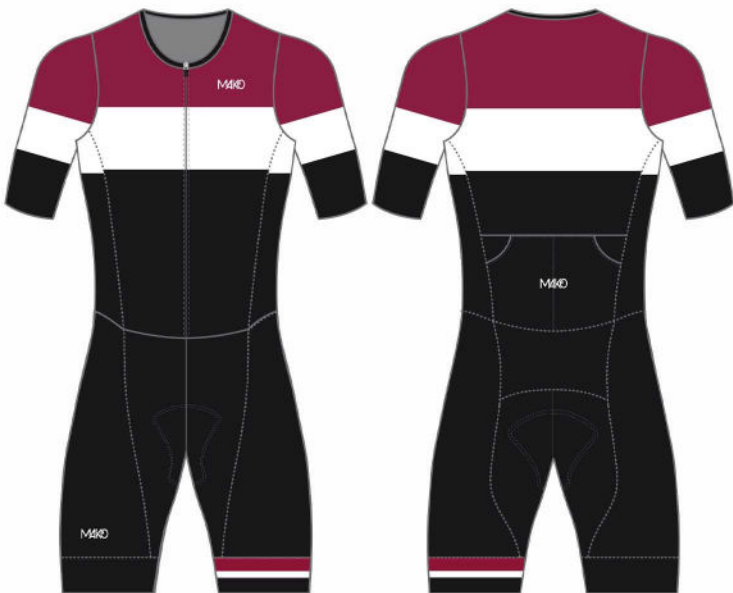
WIDE BAND : BORDEAUX