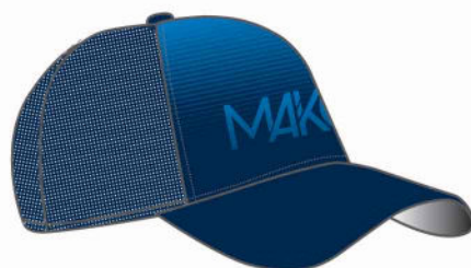
CASQUETTE TRUCKER MK 07020