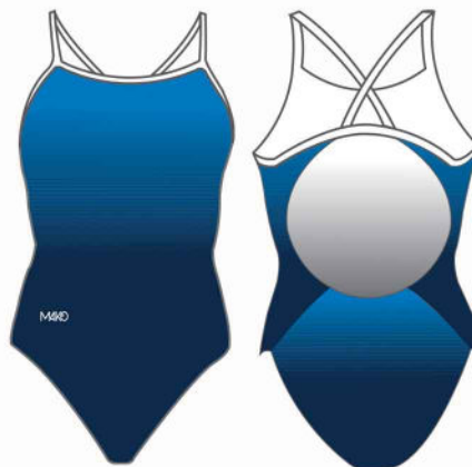
NEREID femme et fille MK23105