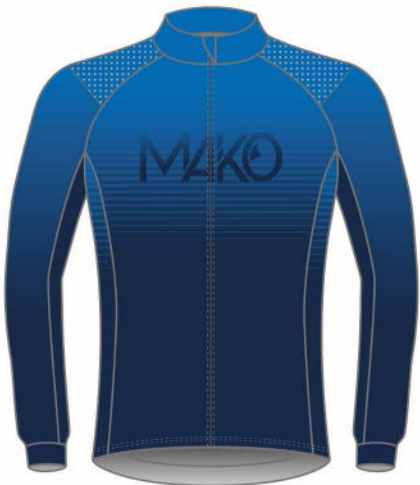
VESTE HIVER VELO PRO 03057 (unisexe)