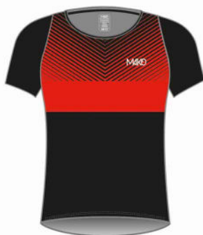
T-SHIRT NATATION TEAM MK 03015 NAT (homme et enfant) MK 03515 NAT (femme)