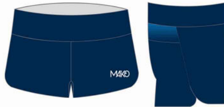
SHORT NATATION PRO MK 17501 SE NAT (femme)