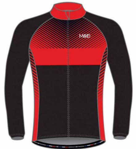
VESTE MI-SAISON TEAM 02101N (homme et enfant) 02158A (femme)