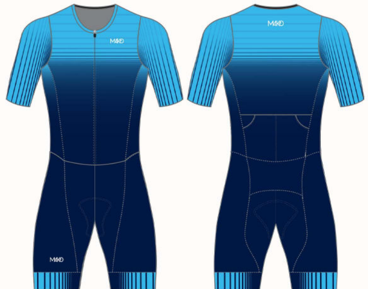
LINES : NAVY