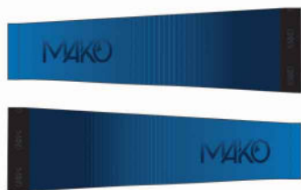
MANCHETTES RUN 07090R A (légère) 07090R T (thermo)