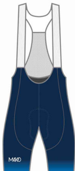
CUISSARD COURT PRO 04028C PRO+ (homme) 16028C PRO+ (femme)