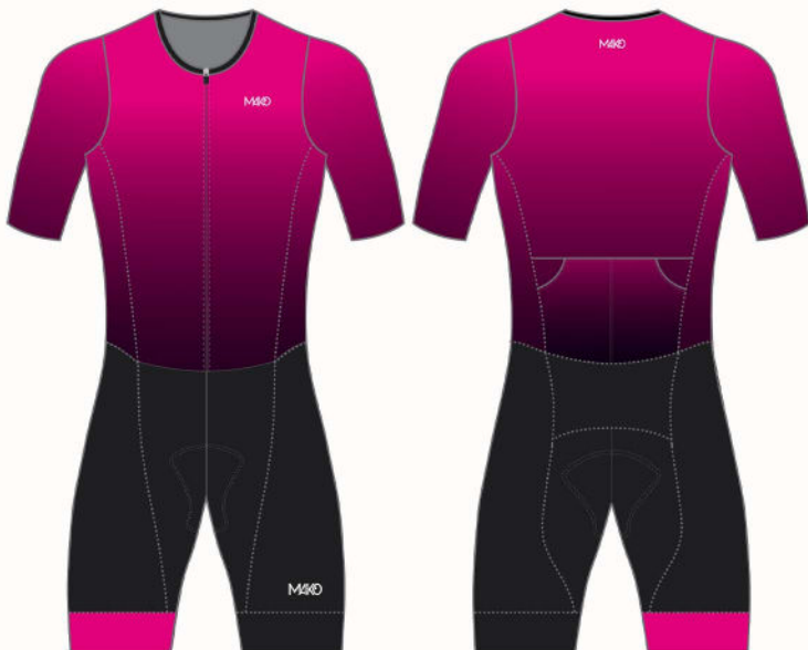
GRADIENT : BLACK-PINK