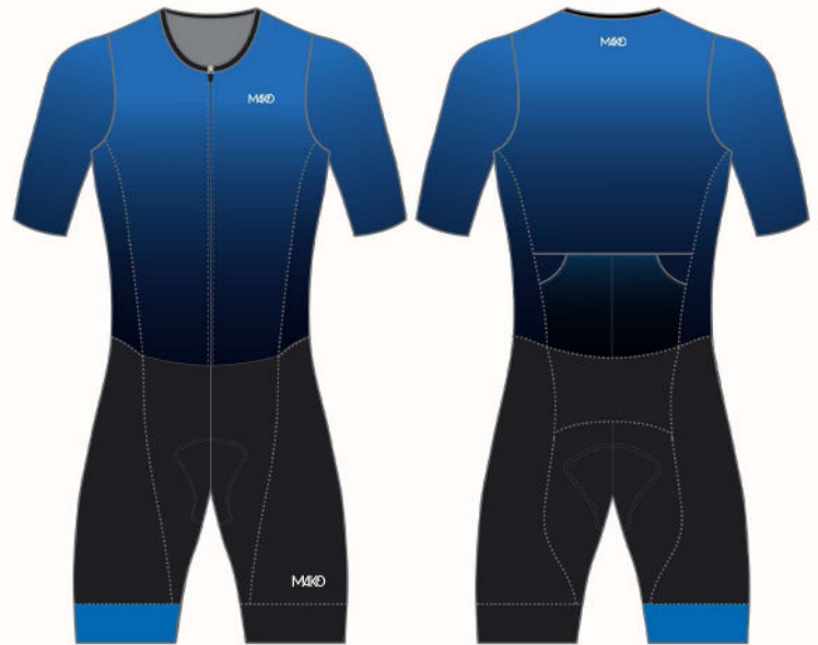
GRADIENT : BLACK-BLUE