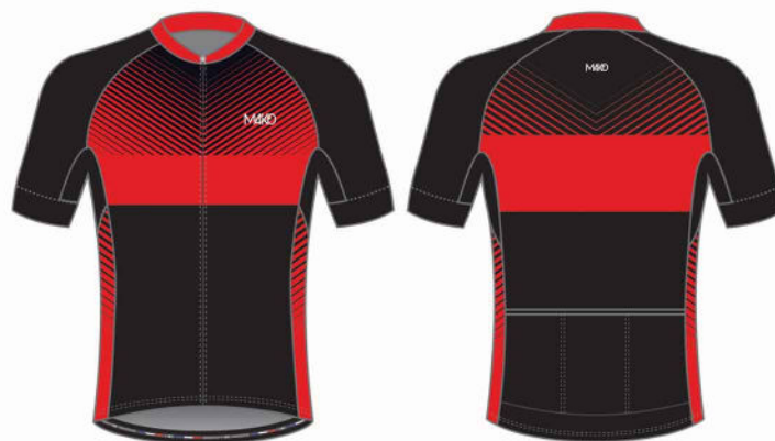
MAILLOT VELO TEAM 02057PBS (homme et enfant) 16057PBS (femme)