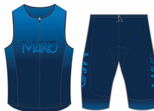
SINGLET ET SHORTY TRIATHLON 05361L (singlet) 05221PB (shorty)