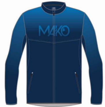
VESTE NATATION PRO MK 18010 NAT (homme et enfant) MK 20510 NAT (femme)