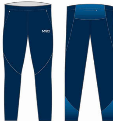
PANTALON NATATION PRO MK 50101 NAT (unisexe et enfant)