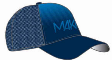
CASQUETTE TRUCKER MK 07020