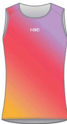
SOUS MAILLOT VELO PRO 01111 (unisexe)