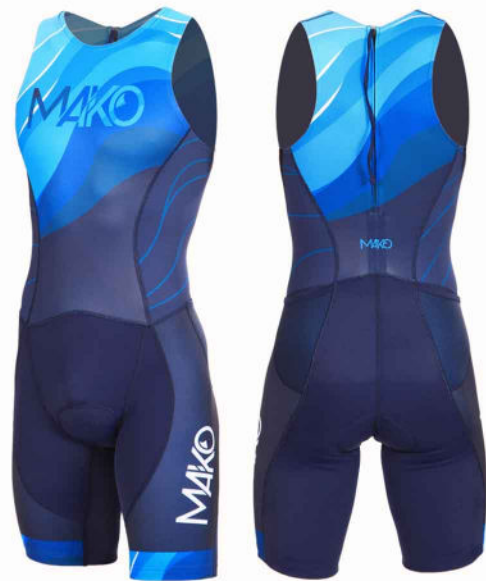
TRI TEAM ZIP DOS MK 0320SPD (adulte) MK 0420SPD (enfant)