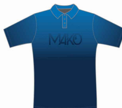
POLO PRO 2008 (homme et enfant) 16008 (femme)