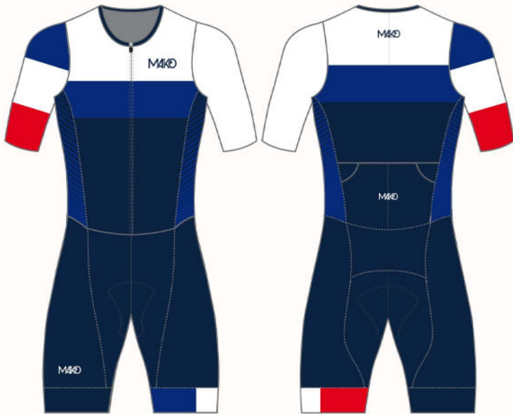
FLAG : FRANCE