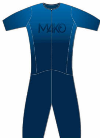
COMBINAISON RUN PRO MK 82045 (homme)