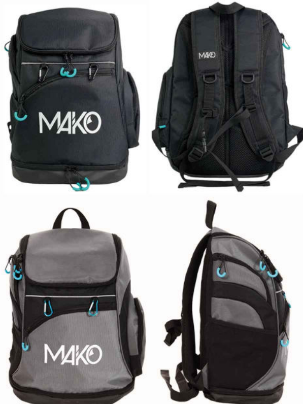
SAC À DOS 5180001 (noir ou gris)