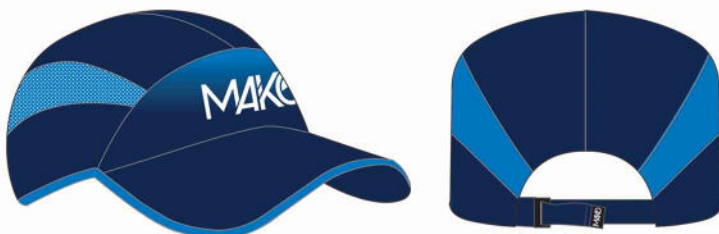
CASQUETTE RUNNING MK 07010