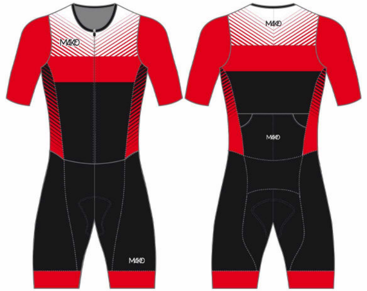
LINE FADE : RED