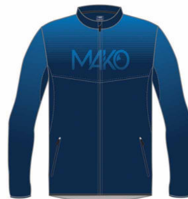
VESTE RUN PRO MK 18010 (homme et enfant) MK 20510 (femme)