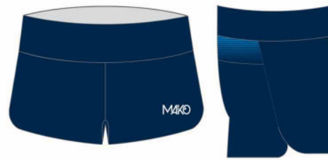
SHORT RUN PRO MK 17501 SE (femme)