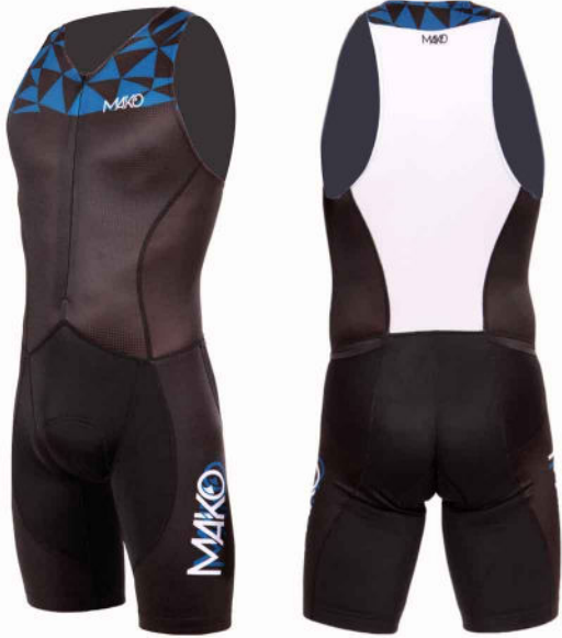
TRI TEAM ZIP DEVANT MK 0310SP (adulte) MK 0410SP (enfant)