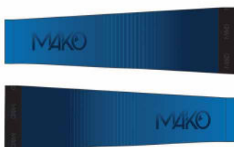
MANCHETTES VELO 07090R A (légère) 07090R T (thermo)

Manchettes personnalisables adaptées tant à la course à pied que pour le cyclisme