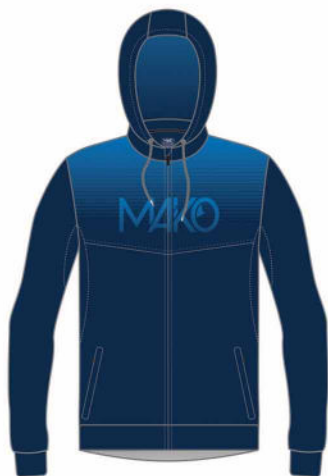
SWEAT PRO MK 18620 (homme et enfant) MK 20820 (femme)