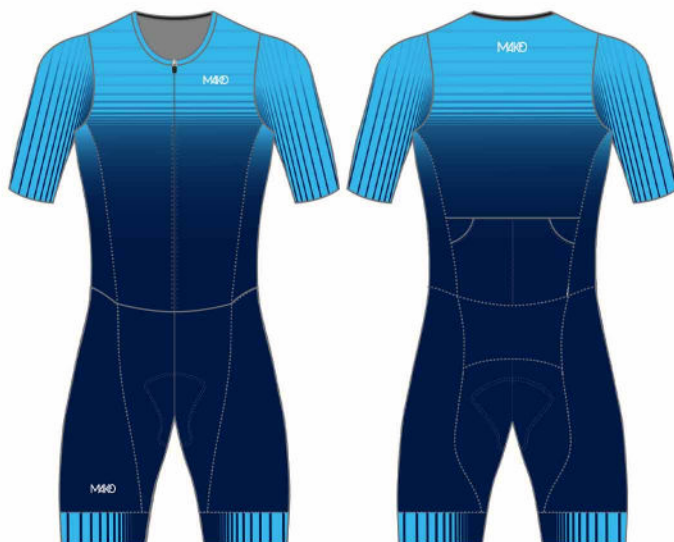
TRIFONCTION SET-IN PRO MK04496TRI GEN2 (homme) MK04098TRI GEN2 (femme)